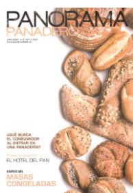
Publicitação Revista Panorama Panadero, Espanha