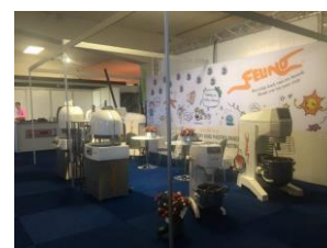
Feira Bakkersvak 2017, Países Baixos