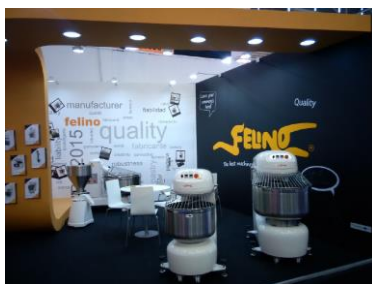
Feira IBA 2015, Alemanha