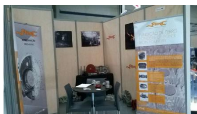
Feira SEPEM 2016, França