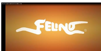
Publicidade em suporte digital