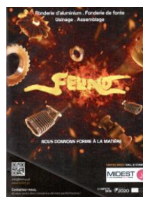
Publicitação Revista L'Usine nouvelle, França