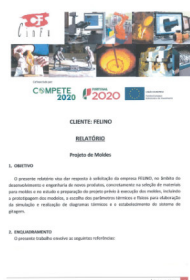
Assistência técnica para desenvolvimento e engenharia de novos produtos