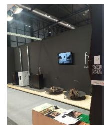
Feira C&R, 2021, Espanha