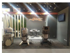
Feira Interscop, 2022, Espanha