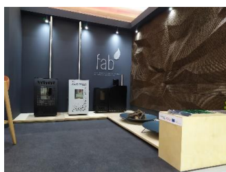
Feira ExpoBiomassa, 2021, Espanha